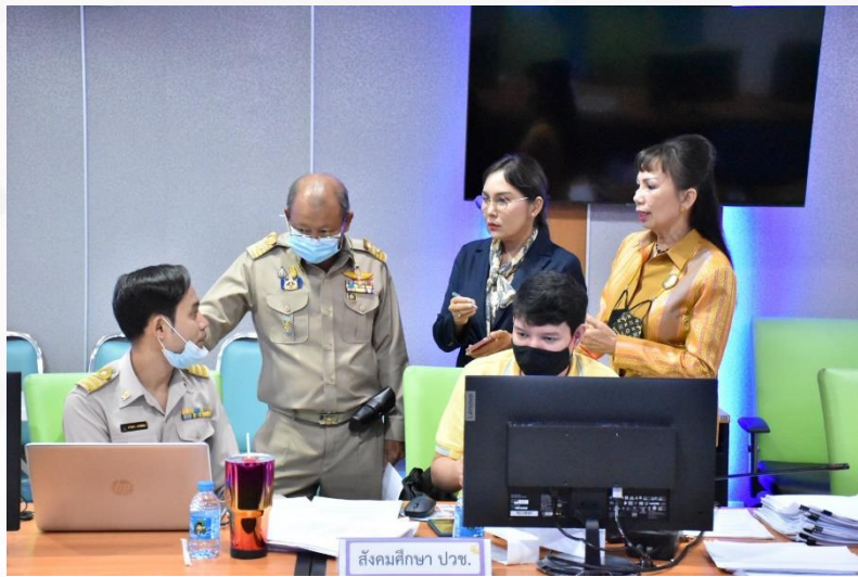
สังคมศึกษา ปวช.