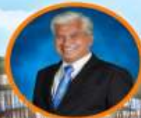
ดร.สุเทพ แท่งสีนทียะ อธิการบดีกรมการอาชีวศึกษา